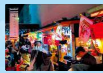
日程 | 10月11日(金) 18:30~20:00 会場 | みろく横丁ほか、中心街の横丁各所

三陸沿岸各地域の芸能団体と、台湾の芸能団体が一堂に会し、屋内外で演舞を披露するほか、ナイトプログラムとして盆踊りも開催！また、複数の文化施設を会場とし、芸能観賞だけでなく八戸文化の展示・体験やワークショップなどの都市回遊型イベントを開催します。