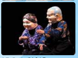
▲アーティスト：赤丸急上昇