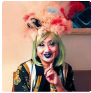
▲三陸国際芸術祭2024アンバサダー アーティスト: ヴィヴィアン佐藤